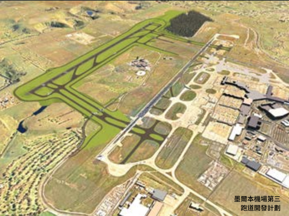
墨爾本機場第三跑道開發計劃

歡迎閱覽墨爾本機場社區通訊第一期，我們將帶您了解機場營運和各項計劃、跑道規劃以及其他相關消息。