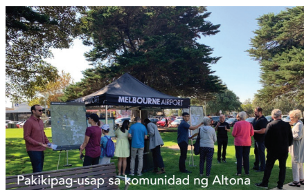
Pakikipag-usap sa komunidad ng Altona

Sa panahon ng 104 na araw ng konsultasyon, nagdaos ang team ng higit sa 50 harap-harapang sesyon ng impormasyon sa mga komunidad na kinabibilangan ng Keilor, Sunbury, Footscray, Altona, Bulla, Taylors Lakes at Sunshine, pati na rin ng maraming online session.