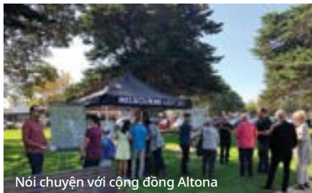
Nói chuyện với cộng đồng Altona

Trong suốt 104 ngày tham khảo ý kiến, nhóm đã tổ chức trên 50 buổi phổ biến thông tin trực diện trong các cộng đồng bao gồm Keilor, Sunbury, Footscray, Altona, Bulla, Taylors Lakes và Sunshine, cũng như nhiều buổi trực tuyến.