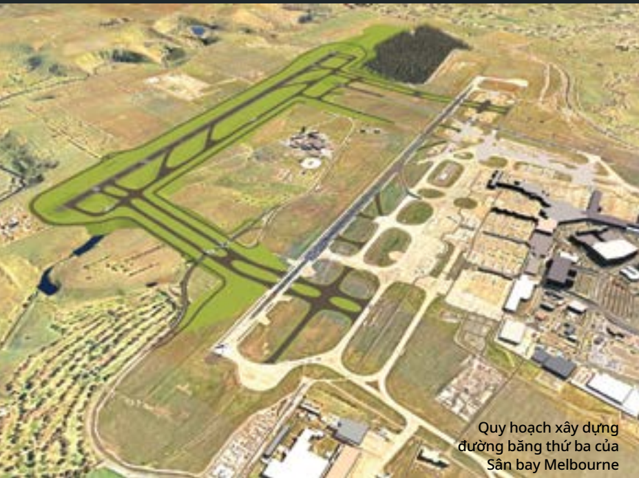
Quy hoạch xây dựng đường băng thứ ba của Sân bay Melbourne

Hoan nghênh quý vị đến với ấn bản đầu tiên của Bản tin Cộng đồng Sân bay Melbourne để giúp quý vị cập nhật thông tin về các hoạt động và dự án của chúng tôi, quy hoạch đường băng và các tin tức liên quan khác.